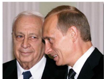
Russian President Vladimir Putin and Israeli Prime Minister Ariel Sharon met in Moscow on Sept. 30, 2002, for talks on the Middle East and ways to build economic and political ties.

ב-30 בספטמבר 2002, נסע ראש ממשלת ישראל, מר אריאל שרון, למספר ימים קצרים למוסקבה כדי לפגוש את הנשיא פוטין "ולשוחח על קשרים כלכליים" בין שתי המדינות. מה הם סגרו שם ביומיים? חודש לאחר מכן מתחילה להיחשף בערוצי תקשורת בעולם העיסקה שנחתמה (או העומדת בפני חתימה) בין שתי המדינות. נראה כי עסקה שכוחה מימי השאה הפרסי עוד בשנת 1968 עומדת לקבל חיים חדשים בעלי השלכות גיאו-